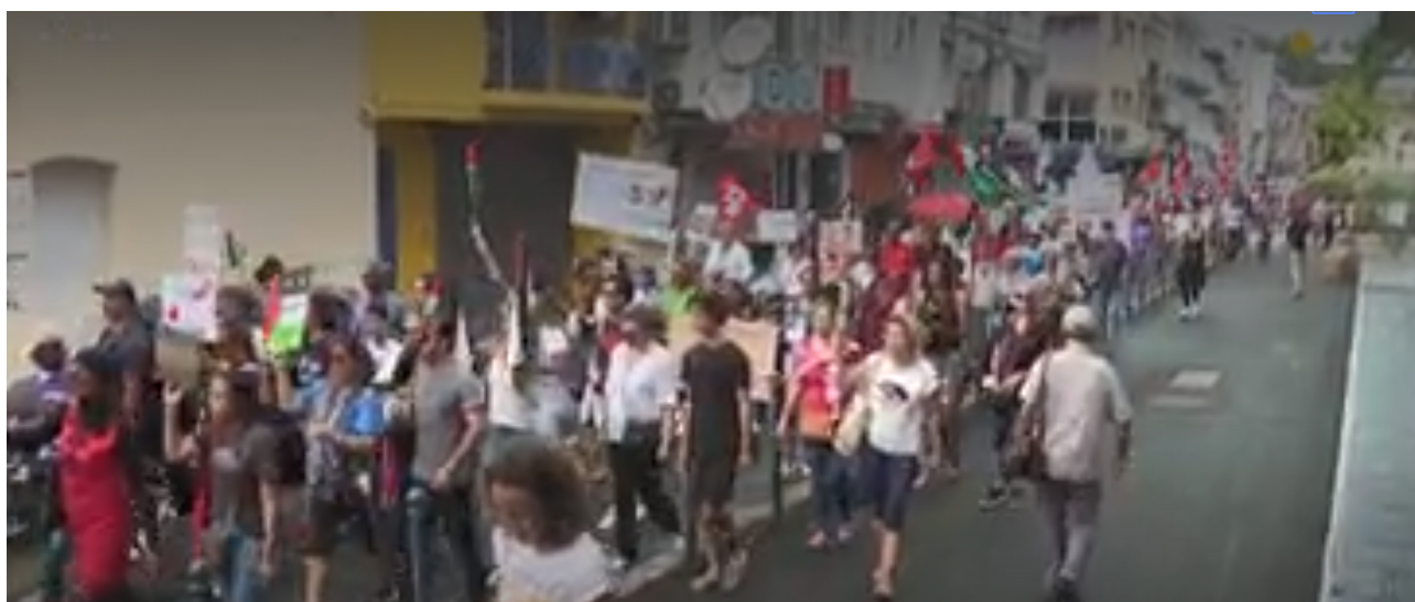
Mobilisation dans les rues de Fort-de-France le Samedi 4 novembre 2023

Un appel à se mobiliser le Samedi 4 novembre avait été lancé au niveau mondial par des centaines d'organisations de défense des droits humains, des centrales syndicales et autres organisations des mouvements populaires. Le moins que l'on puisse dire c'est que l'appel a été entendu. Ce sont des centaines de milliers de personnes qui se sont mobilisées sur tous les continents pour dire « Halte à la barbarie ! ». Chez nous aussi, des centaines de compatriotes au côté de la Communauté Palestinienne ont tenu à exprimer leur colère contre les crimes de guerre commis par l'armée d'occupation sioniste et contre la collaboration honteuse des puissances occidentales.