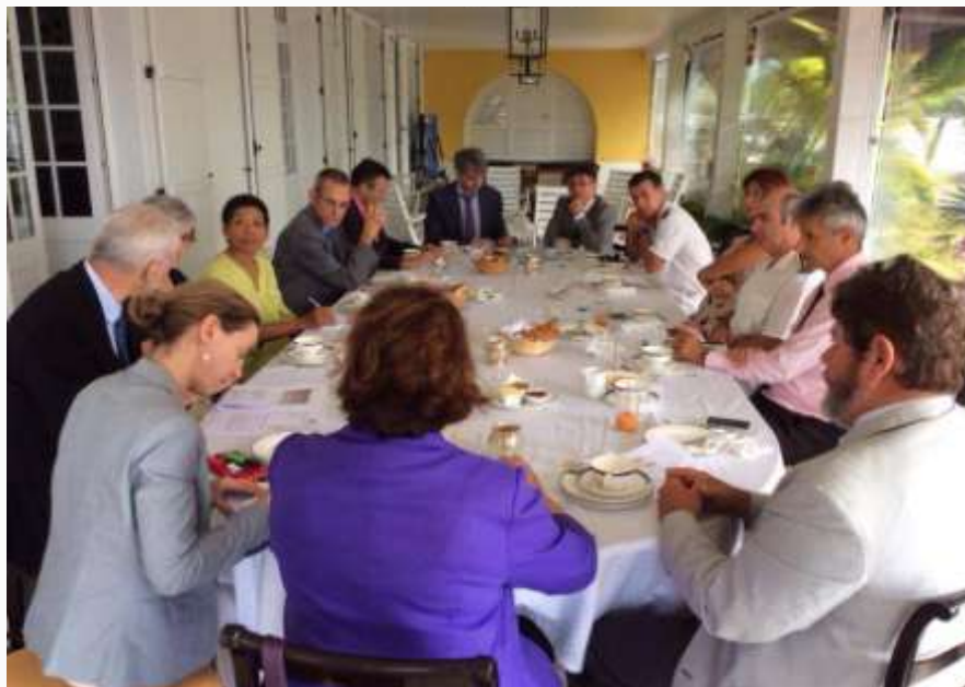
Madame PAU LANGEVIN, Ministre de l'outre-mer dans cette réunion de travail avec les hauts administrateurs de services de la Martinique, dont la priorité serait l'emploi des jeunes..

« Une photo qui interroge » publiée sur le site madinina-art.net (15 mars 2015)