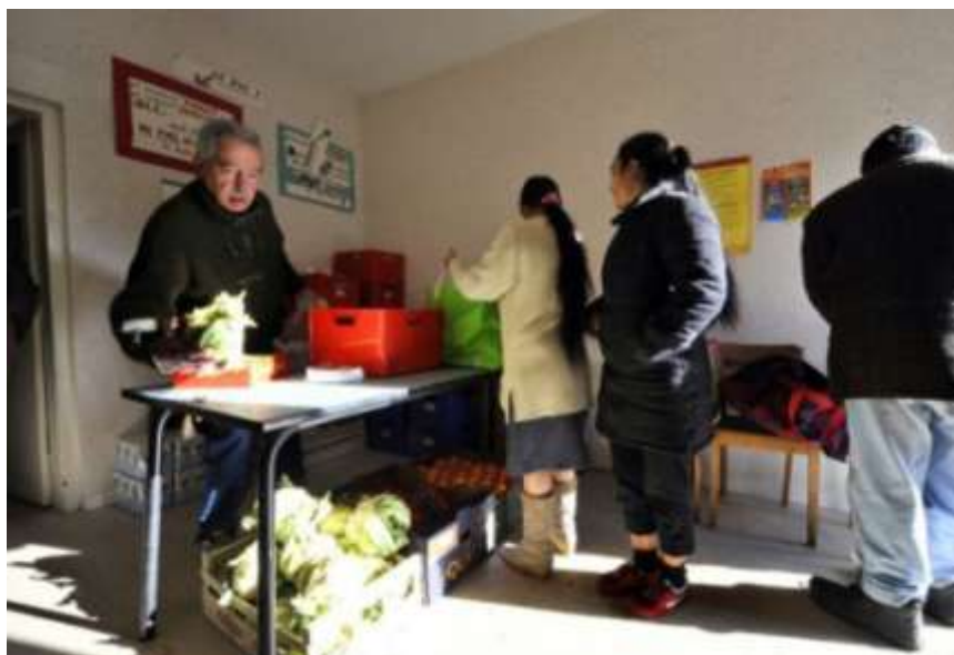
Un bénévole du Secours Catholique distribue des colis de nourriture de la Banque Alimentaire, le 4 décembre 2009 à Saint-Eloy-les-Mines.

« CAC 40 : des profits sans partage » c'est le titre d'un rapport publié par l'ONG Oxfam dans lequel on apprend que « En 2017, les entreprises constituant l'indice phare de la Bourse parisienne ont versé 45,1 milliards d'euros de dividendes (NDR. à leurs actionnaires). Ce chiffre pourrait atteindre les 46,8 milliards cette année selon les estimations de Factset Estimates ». Dans le même temps, seuls 27,3% des profits ont été consacrés au réinvestissement et les salariés n'ont eu droit qu'à 5,3 %. Cette information doit être rapprochée d'une autre réalité, révélée par un baromètre Ipsos-Secours Populaire